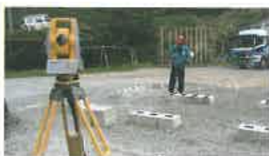
自動追尾型測量器械 IS とデータコレクタを使った測量