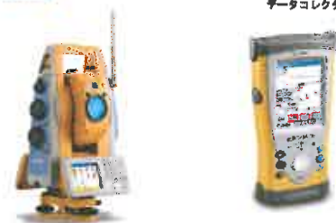
左：自動追尾型測量器械 IS 右：データコレクタ