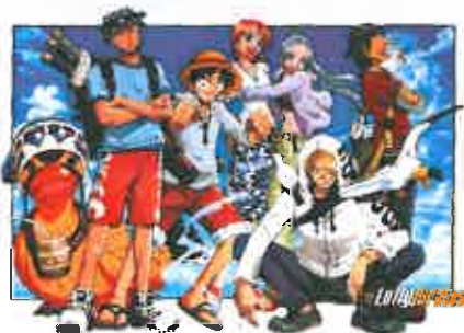
【ワンピースとは・・・】

現在こうして 26 年を小原建設で仕事をさせて頂き、考えてみると人生の 2/3 近くをここで過ごしていることとなります。仕事では、品質・安全・コストの面で当時とは見違えるほど高度化し、職員も、より優秀な人達ばかり。あらためて時代の流れは凄いなと思います。時代の流れといえ、トイレが水洗になったのはホントに素晴らしいと思う。自分だけ？